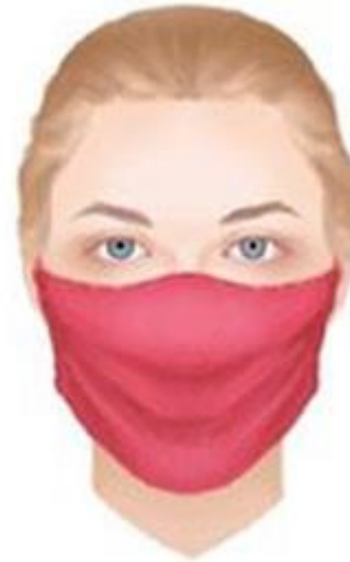
Selbstgebastelte Maske aus Baumwolle