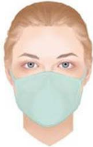
FFP2 / FFP3- Maske ohne Ventil