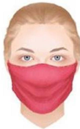
házilag készült arcvédő maszk