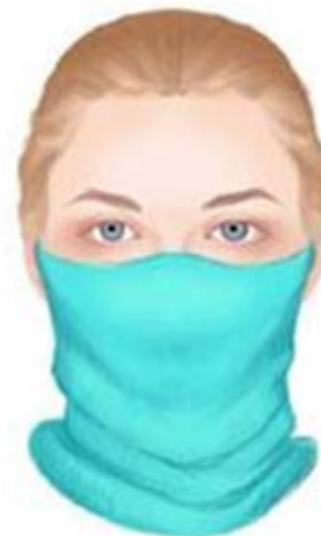
sál / kendő